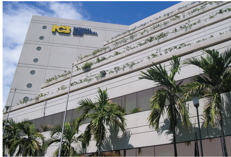
Portland acquired The National Commercial Bank of Jamaica in 2002.

À la suite de l'acquisition de AIC Limited en 1987, Michael s'est attaché à développer le groupe de sociétés Berkshire composé d'une société de planification de placements, d'un courtier en valeurs